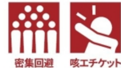
密集回避 咳エチケット