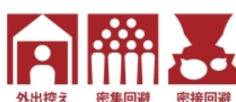
外出控え 密集回避 密接回避