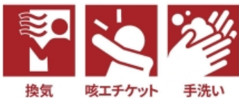
換気 咳エチケット 手洗い