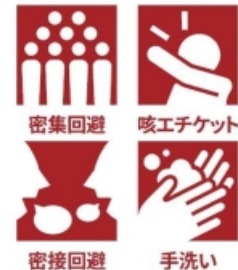
密集回避 咳エチケット 密接回避 手洗い