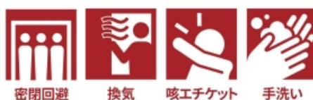
密閉回避 換気 咳エチケット 手洗い