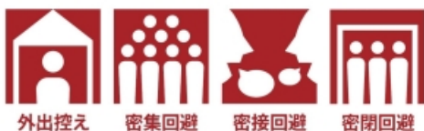
外出控え 密集回避 密接回避 密閉回避

さらにお願ひ：お友達にもぜひ3つのお願いを伝えていただけませんか。以下のロゴをご家庭や学校、職場において自由にお使いください。（6バージョン）