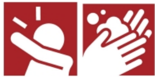
咳エチケット 手洗い

新型コロナウイルス感染症は、罹患しても約8割は軽症で経過し、治癒する例が多いことが報告されていますが、高齢者や基礎疾患をお持ちの方は、重症化するリスクが高いことが報告されています。皆さまご自身を守るため、そして、大切な人を守るため、3つのお願いへのご協力をお願いします。