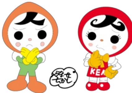
人権イメージキャラクター 人KENまもる君