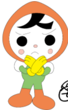
人権イメージキャラクター 人KENまもる君