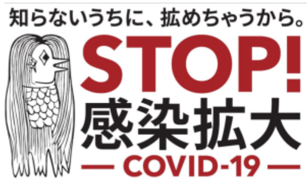
若者の皆さま向け啓発アイコン「アマビエ」

法務省と厚生労働省では、それぞれ新型コロナウイルス感染症に関連する不当な偏見、差別、いじめ等の被害にあった方からの困った時は、一人で悩まず、私たちに相談してください。