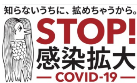
若者の皆さま向け啓発アイコン「アマビエ」