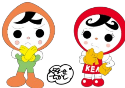
人権イメージキャラクター 人KENまもる君