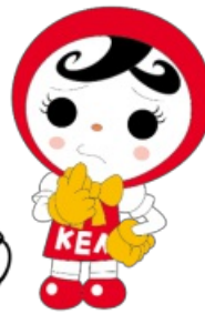
人権イメージキャラクター 人KENあゆみちゃん