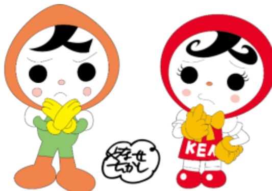
人権イメージキャラクター 人KENまもる君