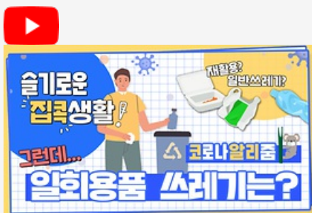
[코로나 뭐든 알리줌 7회] 우리의 지구를 부탁해 똑똑한 슬기로운 집콕생활!