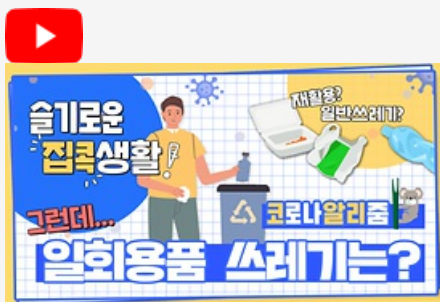
[코로나 뭐든 알리줌 7회] 우리의 지구를 부탁해 똑똑한 슬기로운 집콕생활!