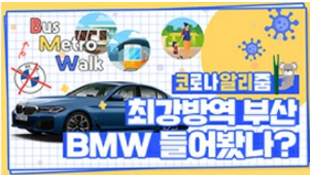
[코로나 뭐든 알리줌 6편] 부산 BMW 믿어도 되나??