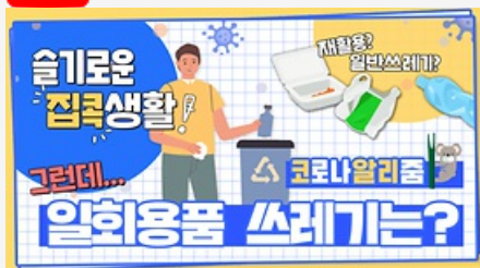
[코로나 뭐든 알리줌 7회] 우리의 지구를 부탁해 똑똑한 슬기로운 집콕생활!