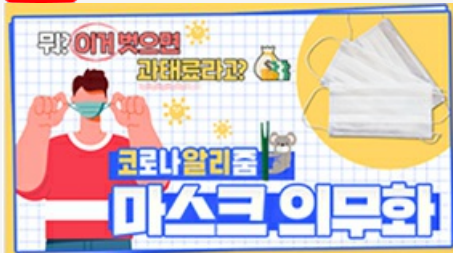
[코로나 뭐든 알리줌 3편] 뭐? 이거 벗으면 과태료 부과?! 마스크 의무화의 모든 것