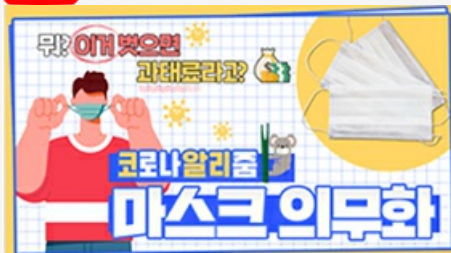
[코로나 뭐든 알리줌 3편] 뭐? 이거 벗으면 과태료 부과?! 마스크 의무화의 모든 것