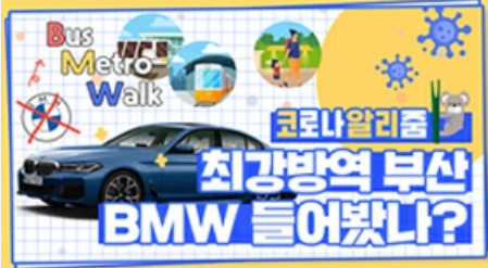
[코로나 뭐든 알리줌 6편] 부산 BMW 믿어도 되나??