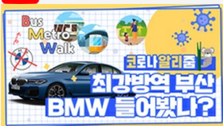
[코로나 뭐든 알리줌 6편] 부산 BMW 믿어도 되나??