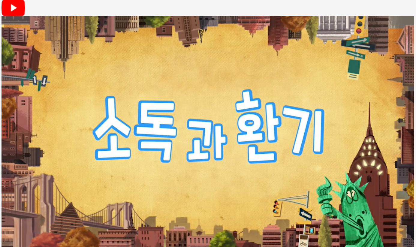
라타와 함께 코로나19 방역수칙 실천해요!