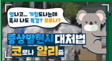
[코로나 뭐든 알리줌 1편] 열나고 기침도 난다! 나도 혹시 독감? 코로나?