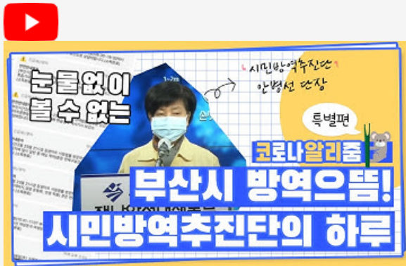
[코로나 뭐든 알리줌 10편] 부산시 시민방역추진단의 하루