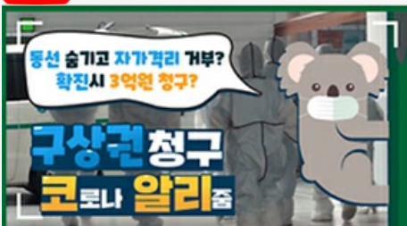
[코로나 뭐든 알리줌 2편] 동선 숨기고 자가격리 거부? 구상권에 관한 모든 것