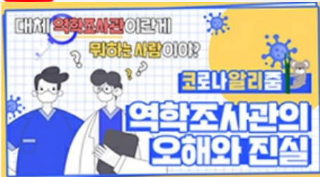
[코로나 뭐든 알리줌 4편] 역학조사관의 오해와 진실! 부산시 역학조사반은 어떤 일을 할까?