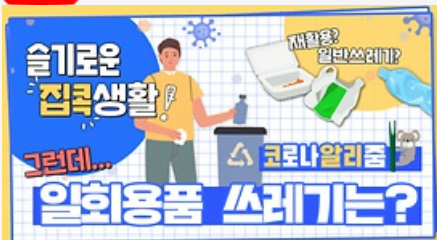
[코로나 뭐든 알리줌 7회] 우리의 지구를 부탁해 똑똑한 슬기로운 집콕생활!