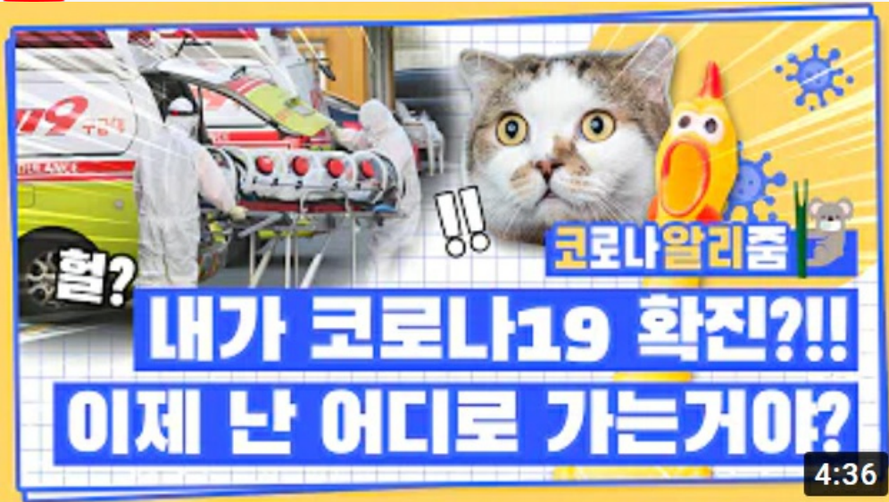
[코로나 뭐든 알리줌 8편] 코로나19 확진자가 되면 생기는 일