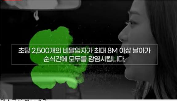
마스크를 벗는 순간