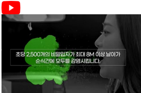
마스크를 벗는 순간