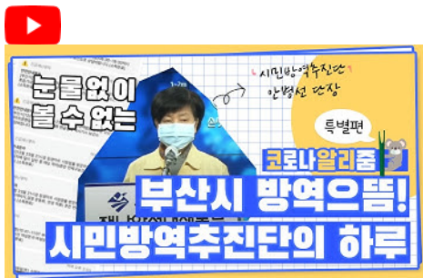
[코로나 뭐든 알리jum 10편] 부산시 시민방역추진단의 하루