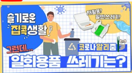
[코로나 뭐든 알리줌 7회] 우리의 지구를 부탁해 똑똑한 슬기로운 집콕생활!