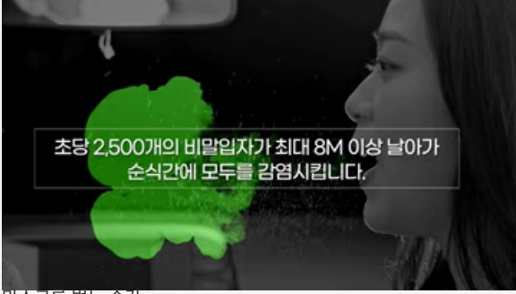
마스크를 벗는 순간