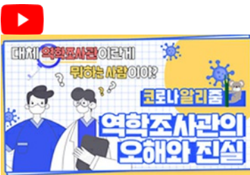
[코로나 뭐든 알리줌 4편] 역학조사관의 오해와 진실! 부산시 역학조사관은 어떤 일을 할까?