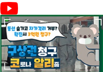
[코로나 뭐든 알리줌 2편] 동선 숨기고 자가격리 거부? 구상권에 관한 모든 것