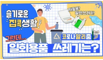
[코로나 뭐든 알리줌 7회] 우리의 지구를 부탁해 똑똑한 즐거운 집콕생활!