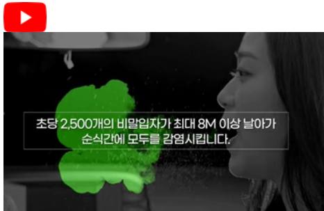
마스크를 벗는 순간