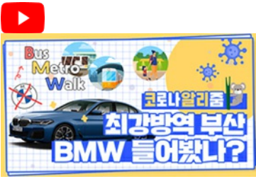
[코로나 뭐든 알리줌 6편] 부산 BMW 믿어도 되나??