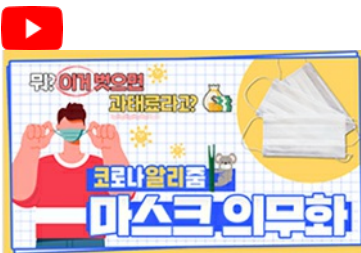
[코로나 뭐든 알리줌 3편] 뭐? 이거벗으면 과태료 부과?! 마스크 의무화의 모든 것