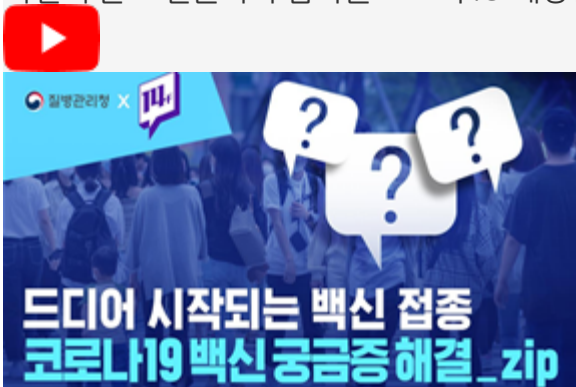
드디어 시작되는 백신 접종 코로나19백신 궁금증 해결