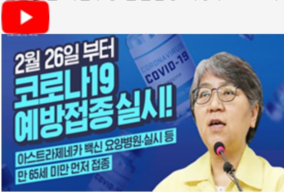
2월 26일 부터 코로나19 예방접종 실시