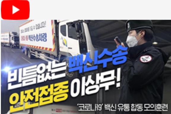
빈틈없는 백신수송 안전점검 이상무! 코로나19 백신 유통 합동 모의훈련