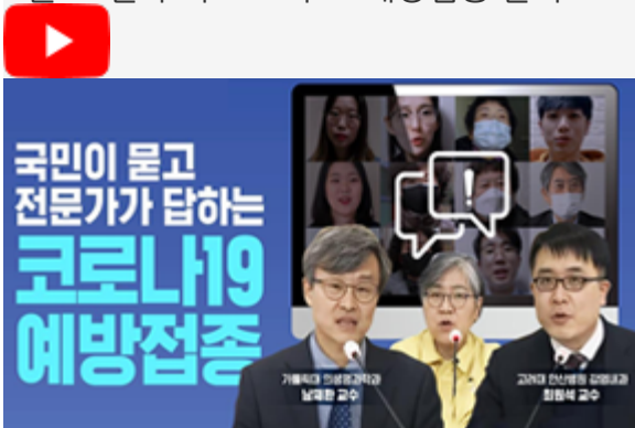
국민이 묻고 전문가가 답하는 코로나19 예방접종