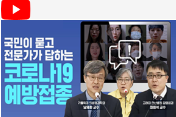
국민이 묻고 전문가가 답하는 코로나19 예방접종