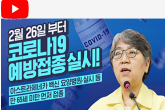
2월 26일 부터 코로나19 예방접종 실시