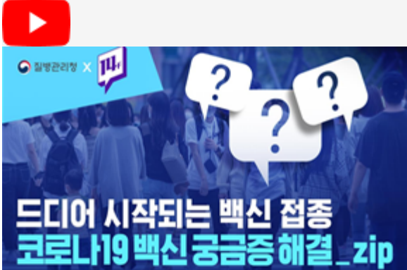
드디어 시작되는 백신 접종 코로나19백신 궁금증 해결