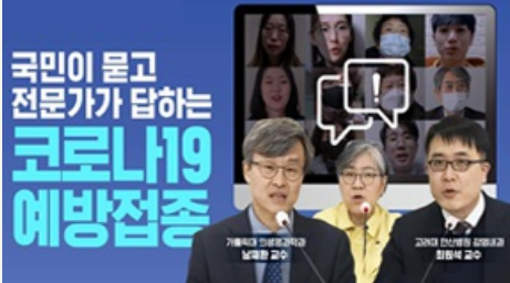
국민이 묻고 전문가가 답하는 코로나19 예방접종