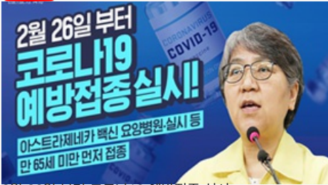
2월 26일 부터 코로나19 예방접종 실시