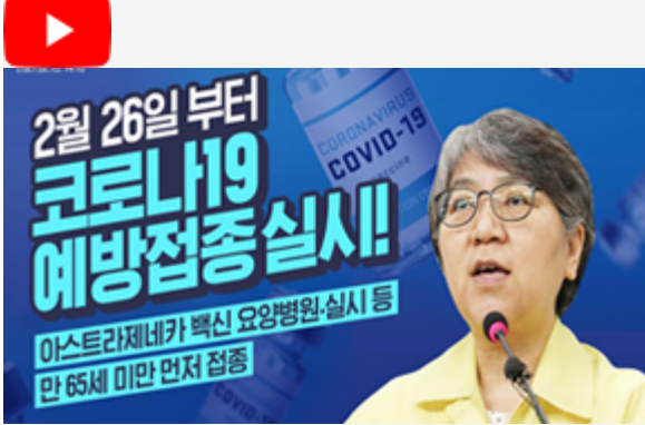
2월 26일 부터 코로나19 예방접종 실시