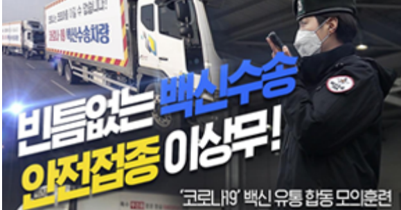
비틈없는 백신수송 안전접종 이상무! 코로나19 백신 유통 합동 모의훈련