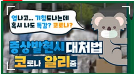
[코로나 뭐든 알리줌 1편] 열나고 기침도 난다! 나도 혹시 똑같은 코로나?