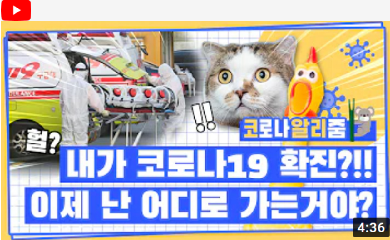
[코로나 워든 알리줌 8편] 코로나19 확진자가 되면 생기는 일