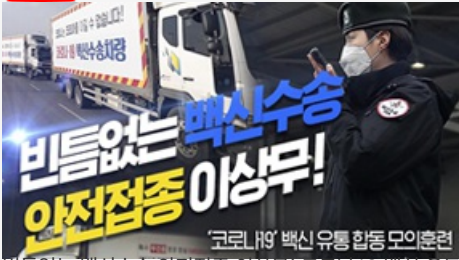
빈틈없는 백신수송 안전접종 이상무! 코로나19 백신 유통 합동 모의훈련