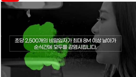
마스크를 뺏는 순간