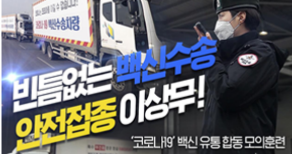
비틈없는 백신수송 안전접종 이상무! 코로나19 백신 유통 합동 모의훈련