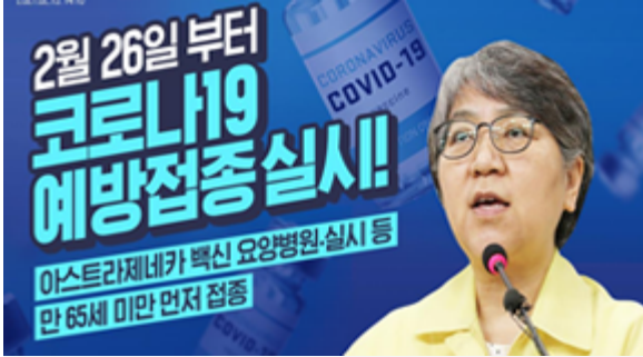
2월 26일 부터 코로나19 예방접종 실시