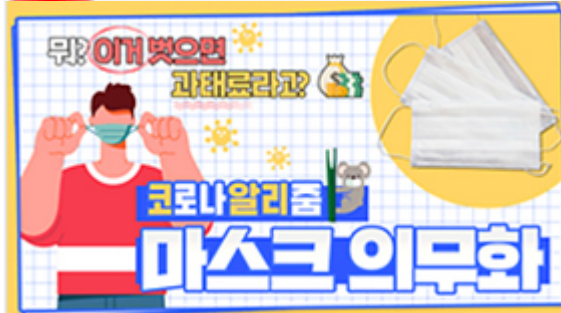
[코로나 뭐든 알리줌 3편] 뭐? 이거벗으면 과태료 부과?! 마스크 의무화의 모든 것