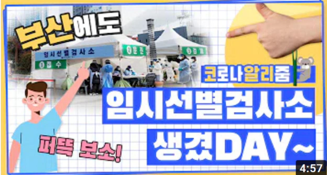
[코로나 워든 알리줌 9편] 부산에도 임시선별검사소 생겼DAY~