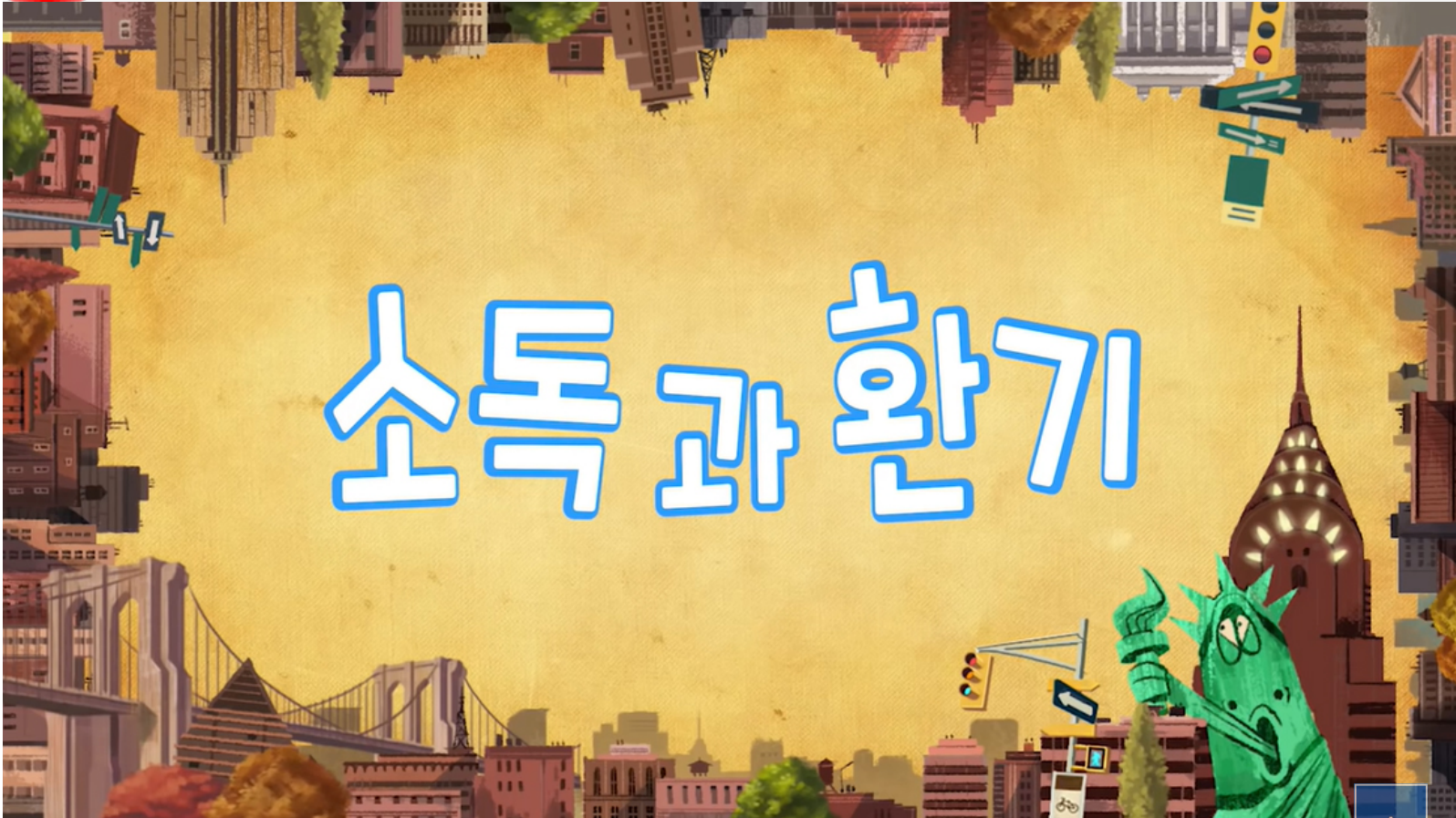
라바와 함께 코로나19 방역수칙 실천해요!