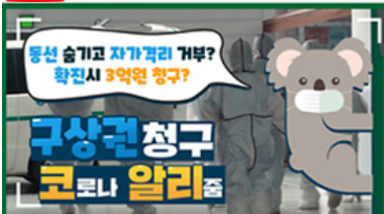
[코로나 뭐든 알리줌 2편] 동선 숨기고 자가격리 거부? 구상권에 관한 모든 것