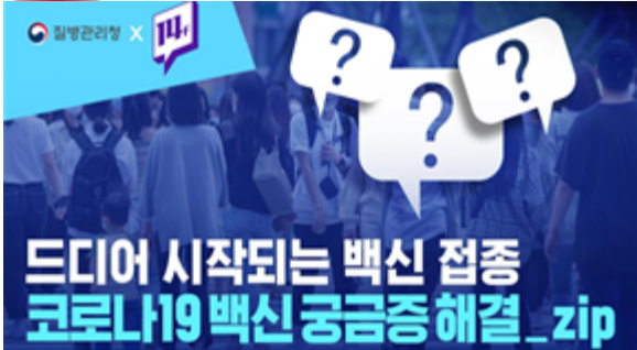
드디어 시작되는 백신 접종 코로나19백신 궁금증 해결