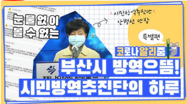
[코로나 뭐든 알리춤 10편] 부산시 시민방역추진단의 하루