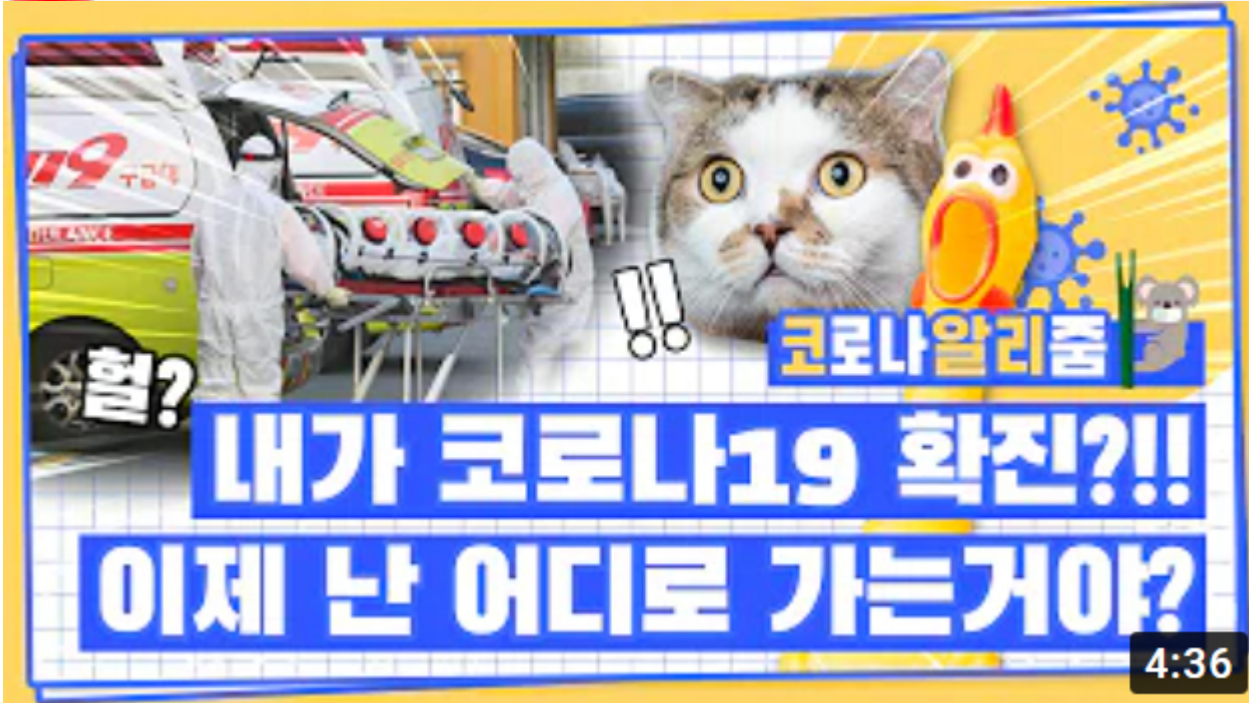
[코로나 워든 알리줌 8편] 코로나19 확진자가 되면 생기는 일