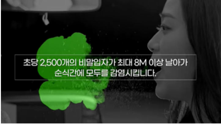
마스크를 벗는 순간