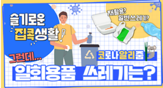
[코로나 워든 알리줌 7회] 우리의 지구를 부탁해 똑똑한 슬기로운 집콕생활!