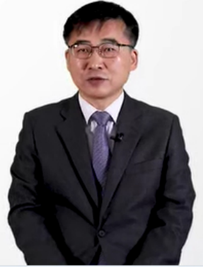
코로나19 예방접종 교육 영상