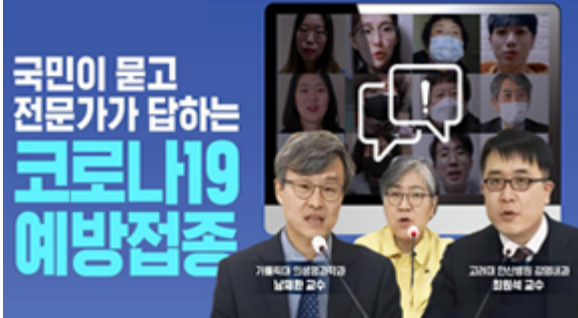
국민이 묻고 전문가가 답하는 코로나19 예방접종