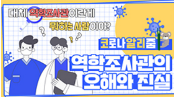
[코로나 뭐든 알리줌 4편] 역학조사관의 오해와 진실! 부산시 역학조사반은 어떤 일을 할까?