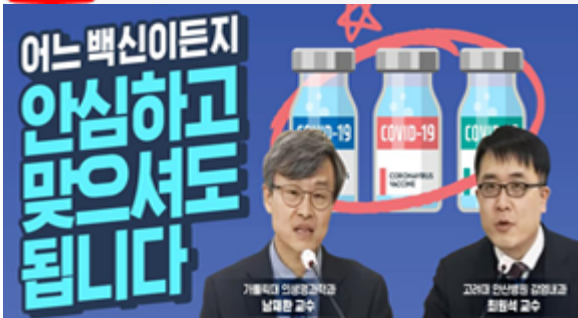
어느 백신이든지 안심하고 맞으셔도 됩니다