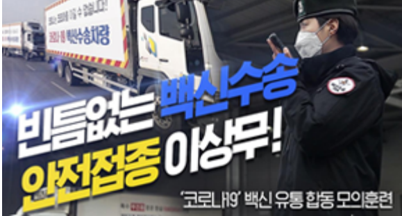
비틈없는 백신수송 안전접종 이상무! 코로나19 백신 유통 합동 모의훈련