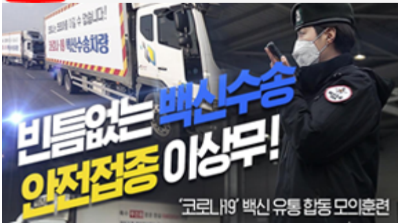
비틈없는 백신수송 안전접종 이상무! 코로나19 백신 유통 합동 모의훈련