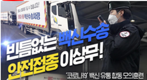
비틈없는 백신수송 안전접종 이상무! 코로나19 백신 유통 합동 모의훈련