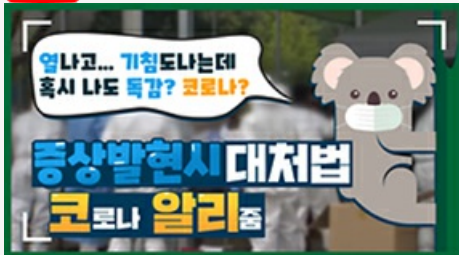
[코로나 뭐든 알리 줌 1편] 열나고 기침도 난다! 나도 혹시 똑감? 코로나?