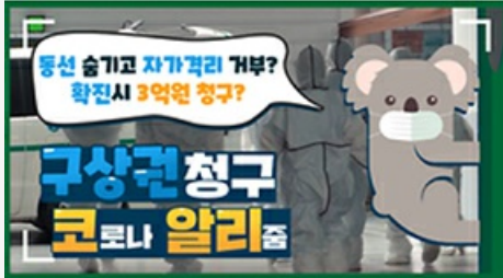
[코로나 뭐든 알리 줌 2편] 동선 숨기고 자가 격리 거부? 구상권에 관한 모든 것