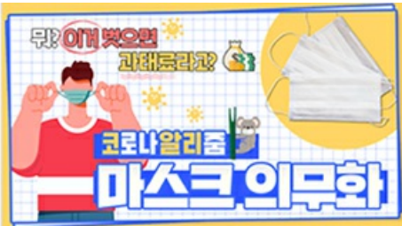
[코로나 뭐든 알리 줌 3편] 뭐? 이거 벗으면 과태료 부과?! 마스크 의무화의 모든 것