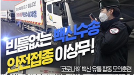
빈틈없는 백신수송 안전접종 이상무! 코로나19 백신 유통 합동 모의훈련