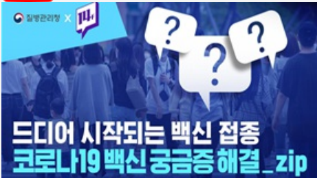
드디어 시작되는 백신 접종, 코로나19 백신 궁금증 해결