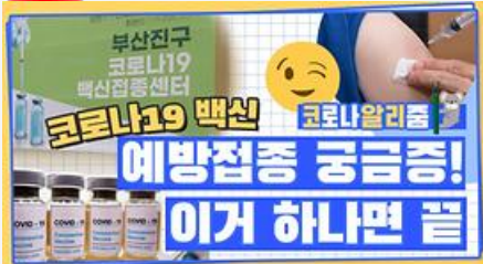
[코알리 워든 알리줌 11편] 부산 코로나19 백신 예방접종 시작