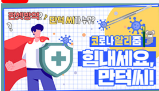
[코로나 뭐든 알리즘 5편] 힘내세요 만덕씨