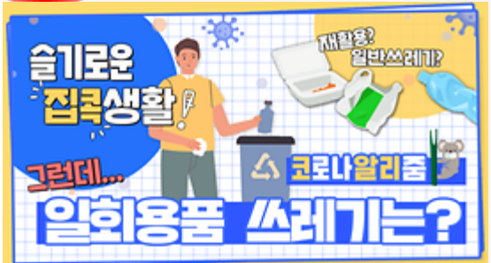
[코로나 뭐든 알리즘 7회] 우리의 지구를 부탁해 똑똑한 슬기로운 집콕생활!