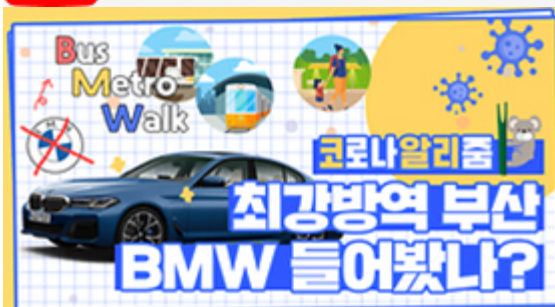
[코로나 뭐든 알리즘 6편] 부산 BMW 믿어도 되나??