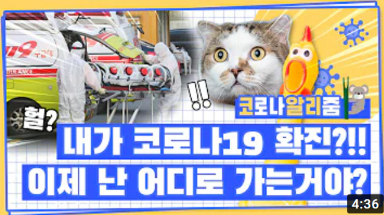
[코로나 뭐든 알리춤 8편] 코로나19 확진자가 되면 생기는 일