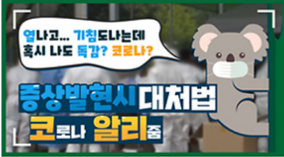
[코로나 뭐든 알리줌 1편] 열나고 기침도 난다! 나도 혹시 독감? 코로나?