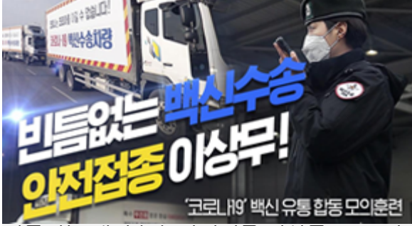
빈틈없는 백신수송 안전접종 이상무! 코로나19 백신 유통 합동 모의훈련