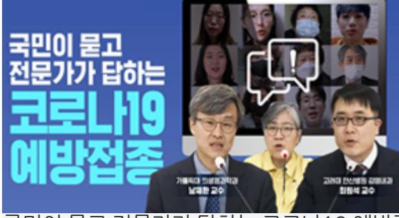
국민이 묻고 전문가가 답하는 코로나19 예방접종