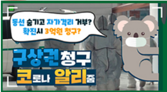
[코로나 뭐든 알리줌 2편] 동선 숨기고 자가격리 거부? 구상권에 관한 모든 것