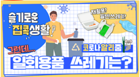
[코로나 뭐든 알리춤 7회] 우리의 지구를 부탁해 똑똑한 슬기로운 집콕생활!