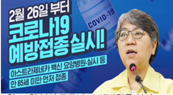
2월 26일 부터 코로나19 예방접종 실시