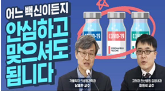
어느 백신이든지 안심하고 맞으셔도 됩니다