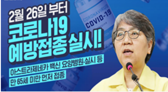
2월 26일 부터 코로나19 예방접종 실시