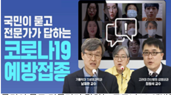
국민이 묻고 전문가가 답하는 코로나19 예방접종