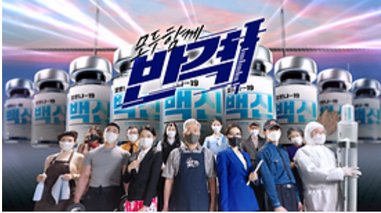
모두함께 반격! 백신접종 시작!