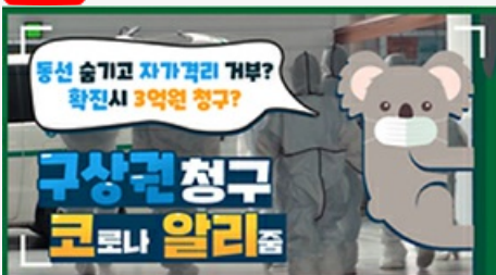
[코로나 뭐든 알리줌 2편] 동선 숨기고 자가격리 거부? 구상권에 관한 모든 것