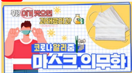
[코로나 뭐든 알리줌 3편] 뭐? 이거 벗으면 과태료 부과?! 마스크 의무화의 모든 것