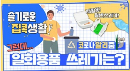
[코로나 뭐든 알리줌 7회] 우리의 지구를 부탁해 똑똑한 슬기로운 집콕생활!