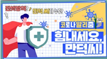
[코로나 뭐든 알리줌 5편] 힘내세요 만덕씨