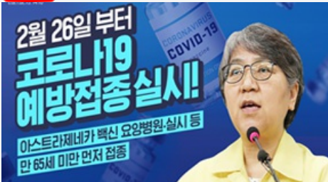
2월 26일 부터 코로나19 예방접종 실시