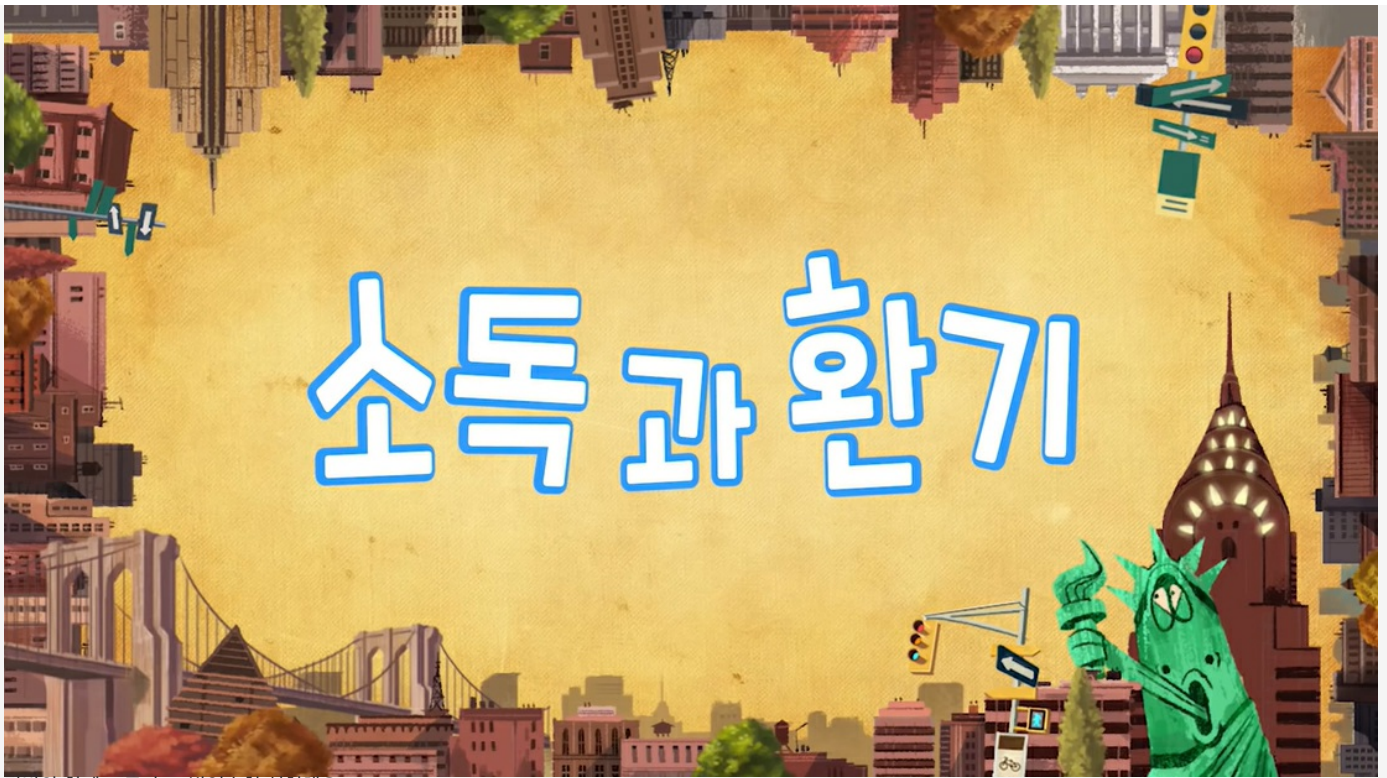
라바와 함께 코로나19 방역수칙 실천해요!