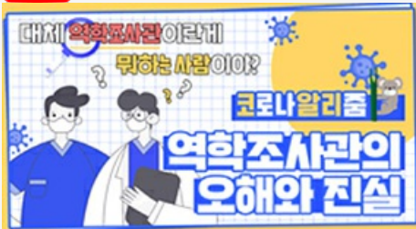
[코로나 뭐든 알리줌 4편] 역학조사관의 오해와 진실! 부산시 역학조사반은 어떤 일을 할까?