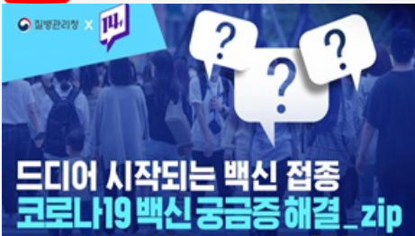
드디어 시작되는 백신 접종 코로나19백신 궁금증 해결