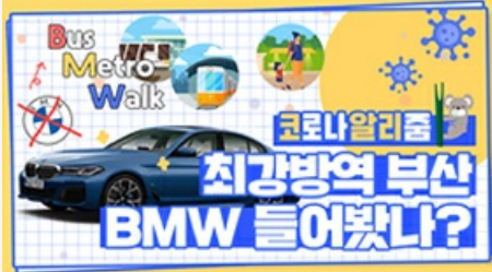
[코로나 뭐든 알리줌 6편] 부산 BMW 믿어도 되나??