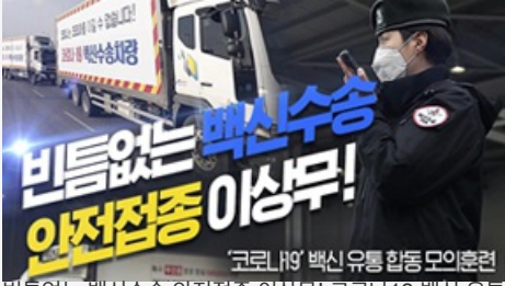
빈틈없는 백신수송 안전접종 이상무! 코로나19 백신 유통 합동 모의훈련