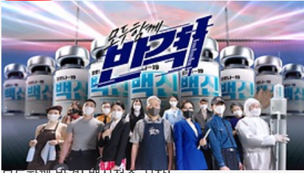
모두함께 반격! 백신접종 시작!