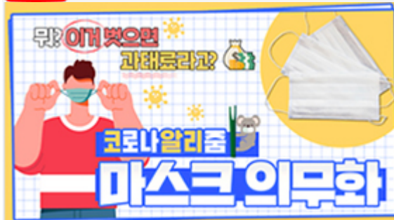
[코로나 뭐든 알리줌 3편] 뭐? 이거 벗으면 과태료 부과?! 마스크 의무화의 모든 것