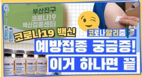
[코알리 뭐든 알리zum 11편] 부산 코로나19 백신 예방접종 시작