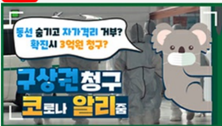
[코로나 뭐든 알리줌 2편] 동선 숨기고 자가격리 거부? 구상권에 관한 모든 것