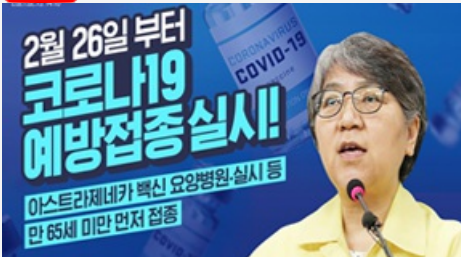
2월 26일 부터 코로나19 예방접종 실시