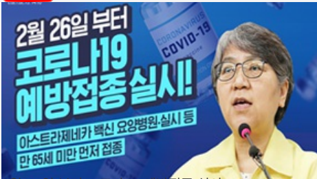
2월 26일 부터 코로나19 예방접종 실시