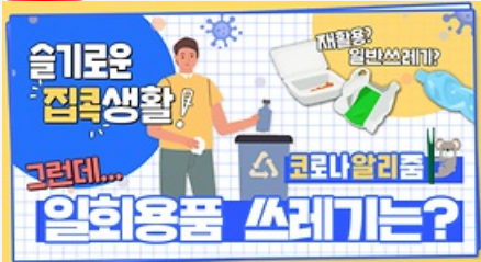
[코로나 뭐든 알리줌 7회] 우리의 지구를 부탁해 똑똑한 슬기로운 집콕생활!