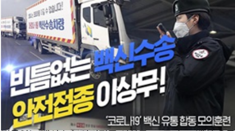
빈틈없는 백신수송 안전접종 이상무! 코로나19 백신 유통 합동 모의훈련