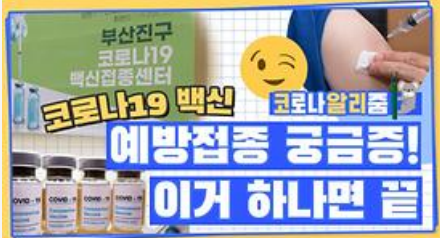
[코알리 워든 알리줌 11편] 부산 코로나19 백신 예방접종 시작