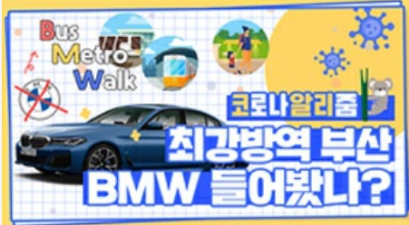
[코로나 뭐든 알리줌 6편] 부산 BMW 믿어도 되나??