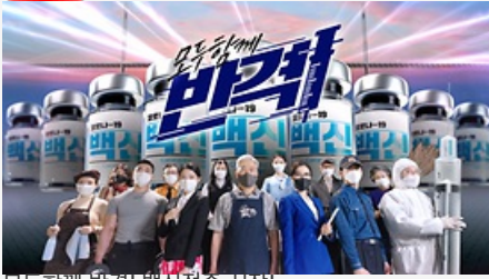
모두함께 반격! 백신접종 시작!