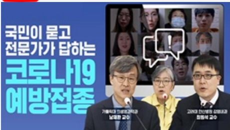
국민이 묻고 전문가가 답하는 코로나19 예방접종