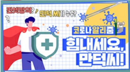
[코로나 뭐든 알리줌 5편] 힘내세요 만덕씨