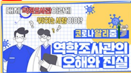
[코로나 뭐든 알리줌 4편] 역학조사관의 오해와 진실! 부산시 역학조사반은 어떤 일을 할까?