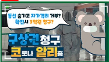
[코로나 뭐든 알리줌 2편] 동선 숨기고 자가격리 거부? 구상권에 관한 모든 것